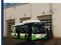
Autobusy Scania Citywide LE u ČSAD Havířov