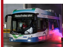
SwissTrolley plus – trochu jiný parciální trolejbus