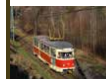
Konec provozu tramvají T2R v Liberci