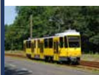
Ohlédnutí za berlínskými tramvajemi KT4D