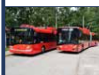
Nové trolejbusy Škoda 27 Tr pro České Budějovice