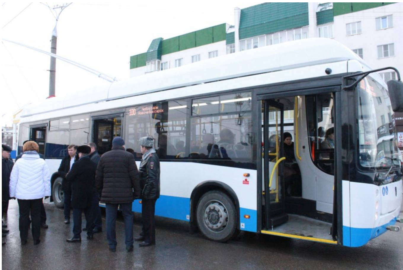
Parciální trolejbus Gorožanin od výrobce UTTZ na meziměstské lince.

U 52 klasických vozů se počítá s částkou 821 600 000 rublů, což je cca 249,560 mil. Kč neboli 4,8 mil. Kč na vůz. V červenci se 41 klasických trolejbusů na leasing pro Petrohrad vysoutěžilo za zhruba 7,38 mil. Kč/vůz. Petrohradská zakázka, jak jsme dnes psali, byla ušita na míru PK „TS“ a nakonec Gorelektrotrans soutěž suspendoval, nicméně tak jako tak se dá čekat, že si s ohledem na stanovené ceny vozy od PK „TS“, které patří na ruské poměry k vyšší cenové třídě, do Čuvaška cestu neprorazí, a to i pokud odečteme náklady na leasing (ostatně i vysoutěžená cena 87 klasických trolejbusů pro Petrohrad byla relativně vysoká, viz zde ). Šanci by spíše mohla mít Trans-Al'fa nebo Ufimskij tramvajno-trolejbusnyj zavod (UTTZ), který už se svým modelem Gorožanin do Čeboksar loni pronikl - tyto vozy byly primárně nasazovány na onu meziměstskou linku 100, zatímco „parciály“ od Trolzy, o kterých jsme loni informovali , na vnitroměstskou linku č. 10, linka 100 ovšem přestala v dubnu t. r. po vypuknutí koronakrizy fungovat, a parciální vozy pak v květnu zamířily za účelem posílení provozu na lince 10, která byla letos prodloužena. Linka 100 má být obnovena až s příchodem 16 parciálních vozů. Ostatně zástupci UTTZ byli před dvěma týdny v Čeboksarách na návštěvě, nicméně podnik UTTZ jako takový nyní nezažívá úplně dobré chvíle, protože do Rostova nedodal 20 parciálních Gorožaninů do října 2019 tak, jak měl, a ten na něm proto začal vymáhat náhrady škody.