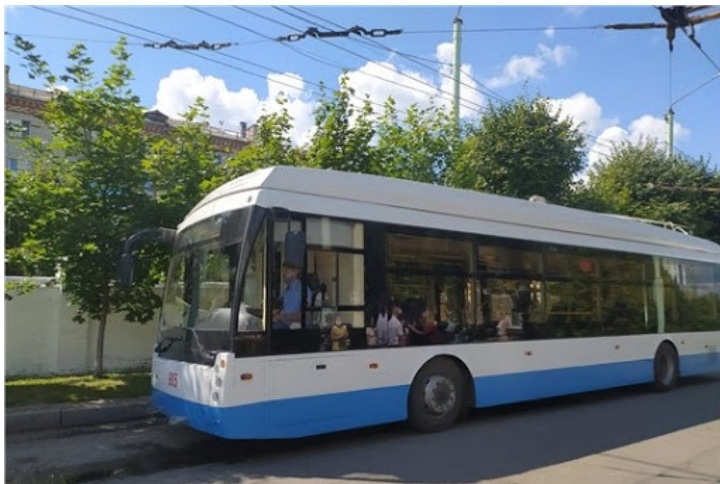
Trolza 5265.08.

Sousední Novočeboksarsk má sice sotva čtvrtinu obyvatel co západně ležící Čeboksary, jeho park trolejbusů je ale jen zhruba osminový, když místní provoz eviduje 33 vozů a okolo 10 z nich je mimo provoz. Pro místní provoz je takovýto stav parku už také nevyhovující.