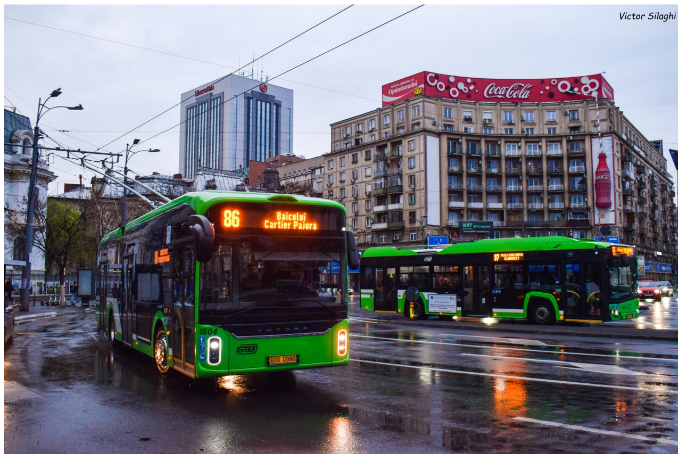
Trolejbus Yutong U12 vedle parciálního trolejbusu Solaris Trollino 12 v Bukurešti.

Jejich premiéra na linkách byla spojena se změnou linkového vedení. S ohledem na to, že nové trolejbusy jsou řešeny jako parciální (z technického pohledu mají blíže k elektrobusům), je možné jimi obsluhovat i úseky bez trolejového vedení. Z trojice jmenovaných linek obsluhovaných Yutongy se změny odehrály na lince č. 86 (linky č. 93 a 97 využívaly bateriové trolejbusy už dříve), která byla významně prodloužena, což umožnilo zrušit autobusovou linku číslo 686.