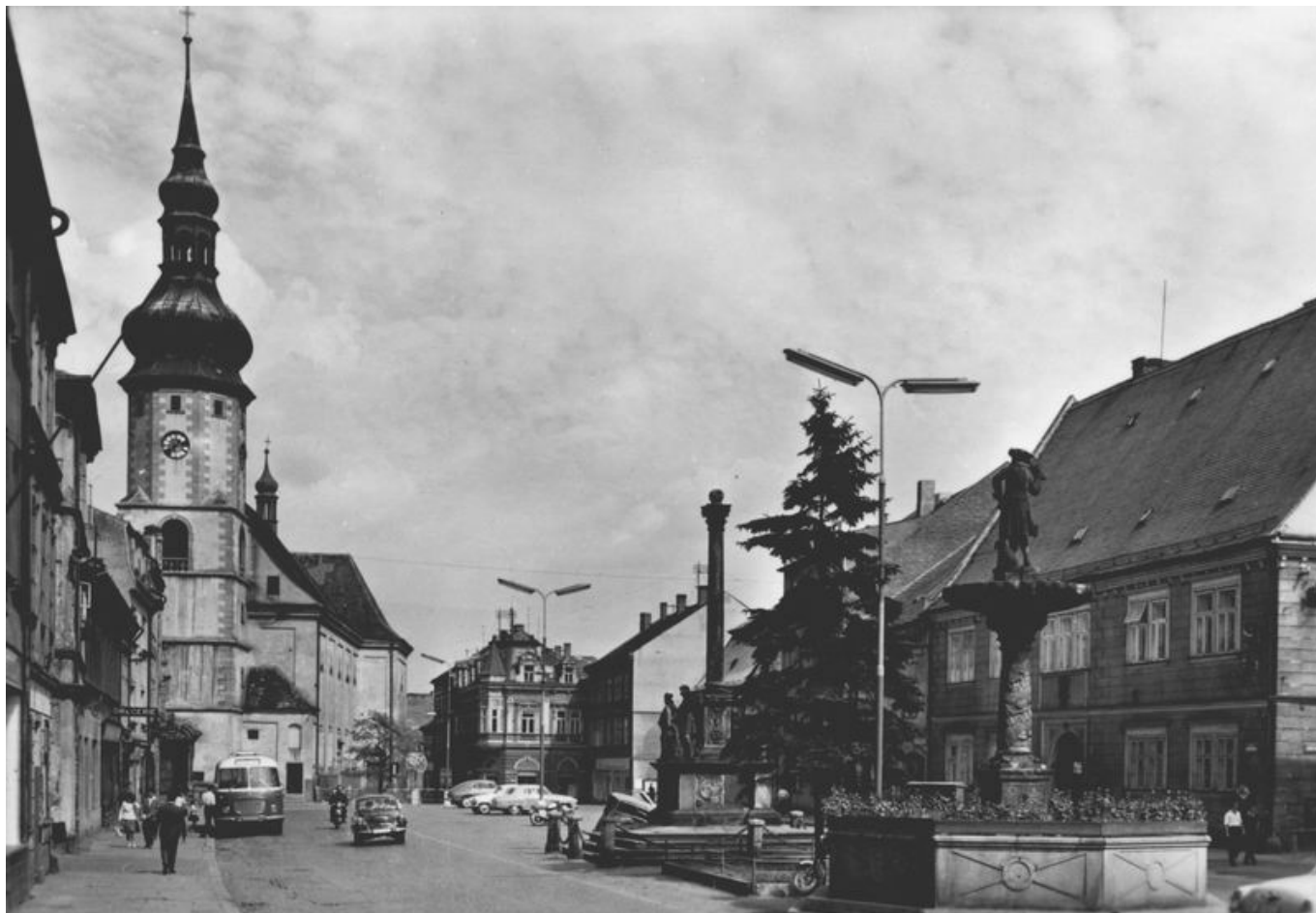
Sokolovské náměstí 9. května s městským vozem Škoda 706 RTO na pohlednici vydané v roce 1967.

Mimo Dolního Rychnova byl předpokládán rozvoj osídlení i v nedaleké obci Březová, která si však svou samostatnost podržela, třebaže byla napojena na sokolovskou MHD. Ta byla řešena poměrně velkoryse, když ji místní závod ČSAD zajišťoval hned na 11 linkách o celkové délce 123 km, které ale měly značně různorodý interval a počet spojů se na každé z nich pohyboval od 6 do 48. Nejnižší špičkový interval vybraných linek činil 10 minut, v sedle nicméně autobusy jezdily v intervalu 40 až 210 (!) minut. Pro provoz sloužilo 30 autobusů, z toho 22 standardní délky a 8 článkových (Ikarus 280). Při průměru 219,3 cest na jednoho obyvatele byla MHD z tehdejšího pohledu velmi solidně využívána (šlo například o vyšší ukazatel, než jakým se mohlo pochlubit souměstí Chomutov - Jirkov, které se, na rozdíl od Sokolova, nakonec trolejbusů dočkalo).