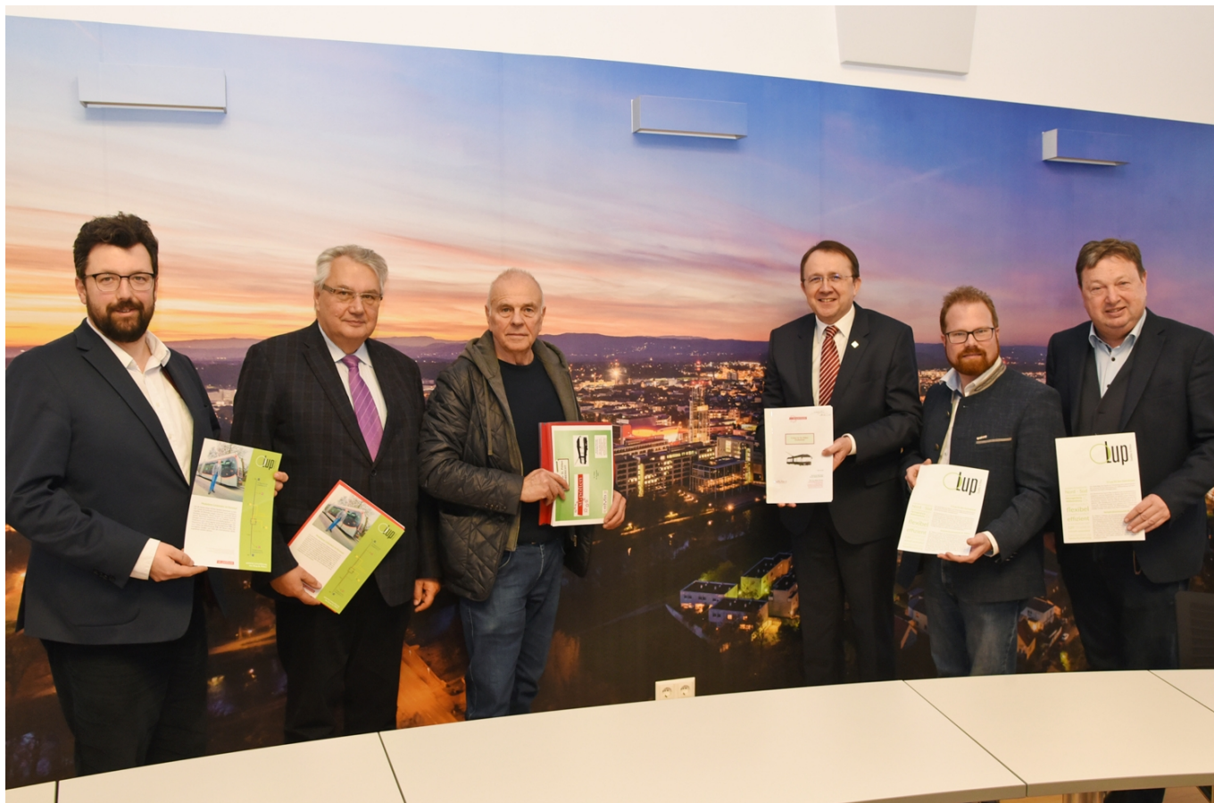
Starostové Sankt Pölten (třetí zprava), Herzongeburgu (druhý zprava) i Wilhemsburgu (třetí zleva) se k myšlence trolejbusové dopravy na dnešní prezentaci společně přihlásili.