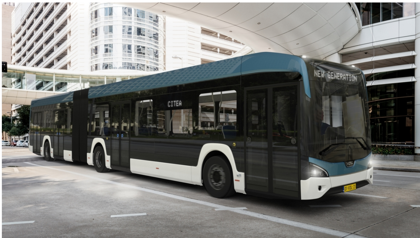
Vizualizace článkového vozu VDL Citea LF-181 o délce 18,1 m.

Důvodem obřího zpoždění byly komplikace při vývoji nového produktu a jeho uvádění v život. S ohledem na zcela odlišné pojetí v porovnání s dřívější generací vozidel (připomeňme, že původní elektrická Citea byla představena již v roce 2013) nebylo možné při výrobě spoléhat na skladové zásoby. Svět byl ovšem v letech 2020–22 významně zasažen absencí dodávek komponentů zejména pro oblast automotive a elektrických pohonů, což v podstatě znemožňovalo start montáže nové generace. Na veletrhu InnoTrans v Berlíně si v září 2022 odbyl premiéru jeden z předváděcích prototypů, což bylo doprovázeno tiskovými zprávami, propagačními videy i informacemi ze zákulisí testování (ty probíhaly tradičně ve Středomoří i za polárním kruhem ve Skandinávii), nicméně sériová výroba ne a ne začít. Navíc bylo později rozhodnuto, že se kompletace elektrobuseů Citea bude soustředit do zcela nového závodu v belgickém Roeselare, kde vznikla moderní továrna (sám výrobce uvádí, že momentálně nejmodernější v Evropě) na ploše 20 000 m 2 , do níž VDL investoval 44 mil. € a která měla začít chrlit vozidla od roku 2023. Ve skutečnosti došlo k jejímu otevření až 10. 4. 2024.