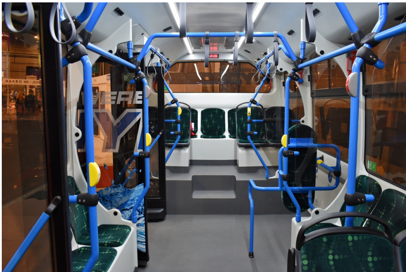
Pohled do interiéru vodíkového autobusu Modulo, resp. elektrobusu s vodíkovým prodlužovačem dojezdu

Bude bezpochyby zajímavé sledovat, jak se bude dále projekt elektrobusů, vodíkových autobusů a případně též trolejbusů Modulo vyvíjet v dalších letech a jakých úspěchů se podaří ve slovenském exilu značce dosáhnout. Maďarské tažení se firmě EVOPRO, resp. MABI-Busu či Ikarusu Egyedi Kft. (podle toho, které období krátké existence značky Modulo si zvolíme), nepovedlo. Sen o velké produkci domácích (tj. maďarských) autobusů byl od počátku stejně reálný jako obrys mapy Maďarska na šále Viktora Orbána. Nyní přichází firma mobility & innovation production s.r.o. s tím, že rozběhne výrobu v řádech stovek kusů na Slovensku - v zemi, která od počátku 90. let zažila snad ještě více vzestupů a pádů nejrůznějších domácích značek autobusů než její jižní soused.