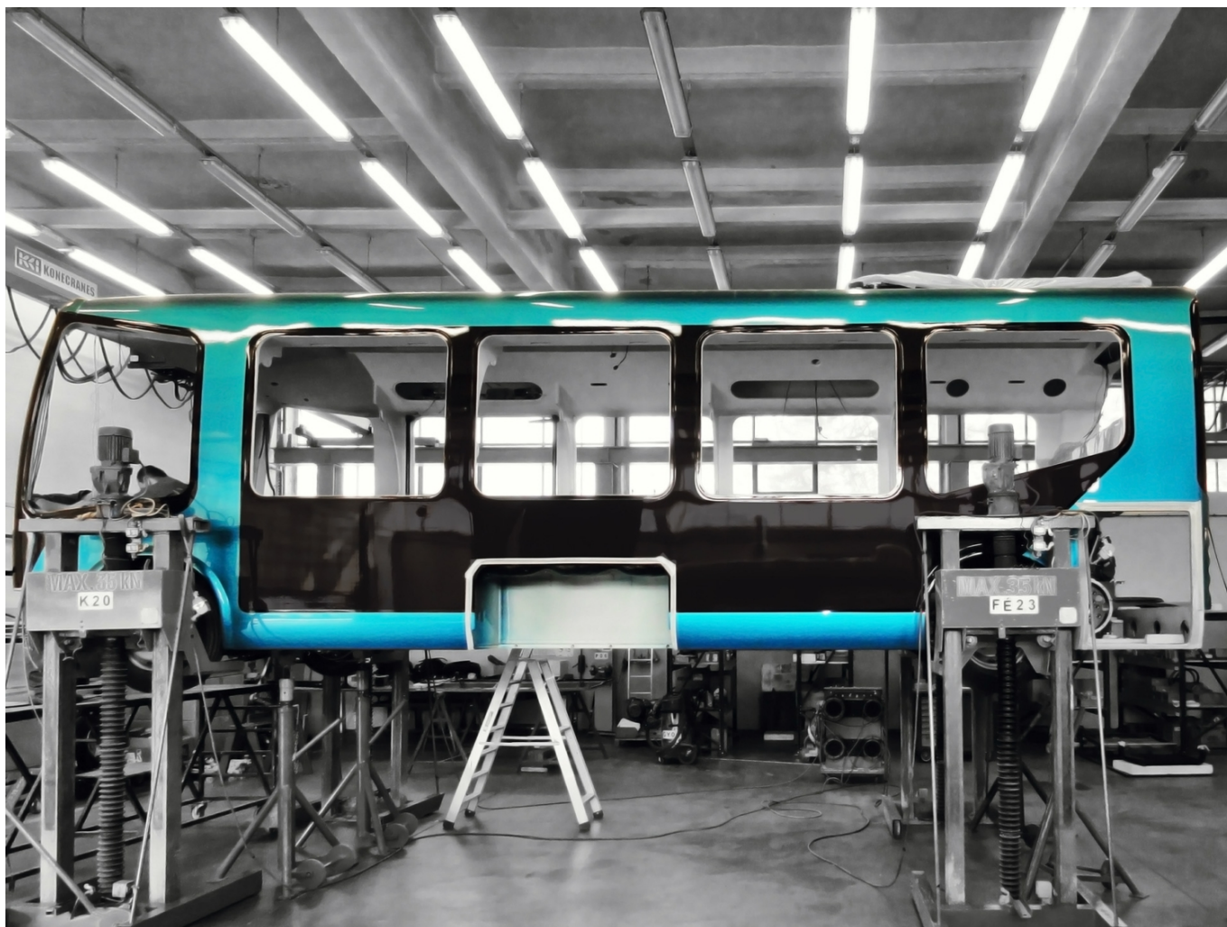
Pohled na nalakovanou karoserii jednoho z vozů Modulo C86e.

Problémy byly jak s pohonným systémem, tak s oním řešením kompozitové skříně vozidla, kde začalo docházet již v roce 2017 k praskání v místě spojení bočnic s podvozkovou částí, což si vynutilo postupné odstávky a opravy vozidel. Kritika se ale týkala také častých výpadků v provozu, a to především v zimním období, kdy byly navíc elektrobuses zesměšňovány v médiích poté, co začaly internetem kolovat obrázky dýmících vozů šplhajících se k budapeštskému hradu, neboť elektrobuses využívaly vskutku žíznivé naftové topení. Dopravce BKV se k poruchám nových vozů vyjadřoval se značnou mírou nelibosti a na dotazy novinářů odpovídal vyhýbavě. Podle některých zdrojů nemělo být výjimečné, že došlo k nevypravení až 75 % všech elektrobuses, v zimě dokonce až 100 %. BKV přitom přišel s poněkud úsměvnou obhajobou, když uvedl, že není pravda, že by elektrobuses vadila zima, problémy měla způsobovat jen vyšší vlhkost.