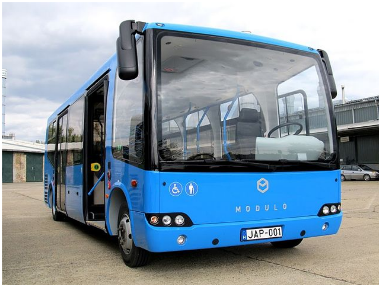
Elektrobus Modulo C86e na propagační fotografii výrobce.

Právě zde vznikla firma mobility & innovation production s.r.o. (MIP), která v roce 2018 odkoupila od Ikarusu Egyedi Kft. práva na pokračování výroby vozidel, stejně jako velké množství rozpracovaného materiálu. Vzhledem k tomu, že ve strukturách slovenské firmy MIP působí v nemalé míře též osoby jako v původní firmě Ikarus Egyedi Kft., nezdráhají se některá maďarská média hovořit o „ uprchnutí manažerů do sousední země “.