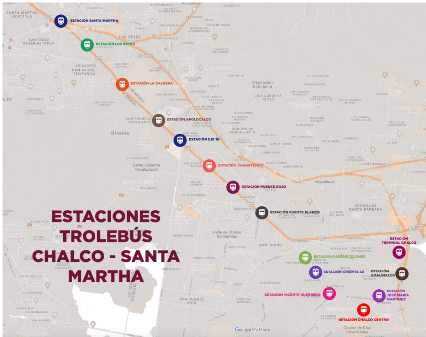
Plánek nové trati.