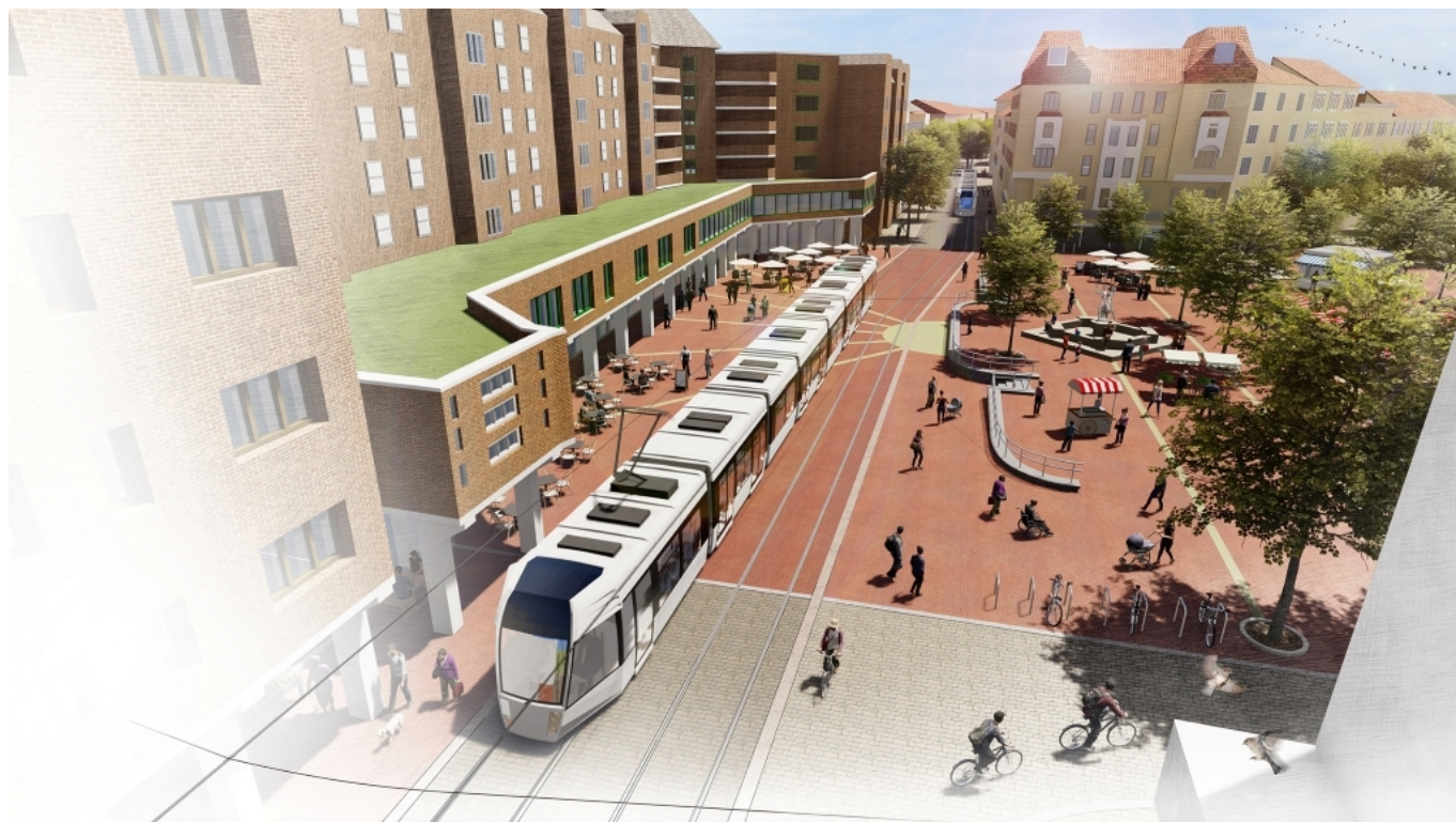
Předpokládaná podoba tramvajové trati v zastávce Gaarden Zentrum Vinataplatz...

Jasněji o budoucí podobě sítě bylo na přelomu let 2012 a 2013, kdy bylo řečeno, že plánovaný rozsah sítě spolkne zhruba 380 mil. € (zhruba 9,3 mld. Kč), současně se ale ukázala ne právě lichotivá čísla předpokládaných provozních nákladů, která nepomohl vylepšit ani příslib zemské vlády na krytí zhruba 40 % těchto plateb. Optimisté přesto do médií prohlašovali, že první vlakotramvaje spojí Kiel s Schönkirchenem ve 13minutovém (špičkovém) taktu už od roku 2015. Místo toho snášel projekt nebývalé množství kritiky, která vyústila v roce 2014 v seškrtání plánovaného rozsahu sítě, ani to však k podpoře záměru nevedlo. Kraje, do nichž měla síť StadtRegionalBahnu zasahovat, vyjádřily všechny – až na jediný – nesouhlas, což v roce 2015 dovedlo i vedení Kielu k rozhodnutí, že nemá smysl v projektu dále pokračovat.