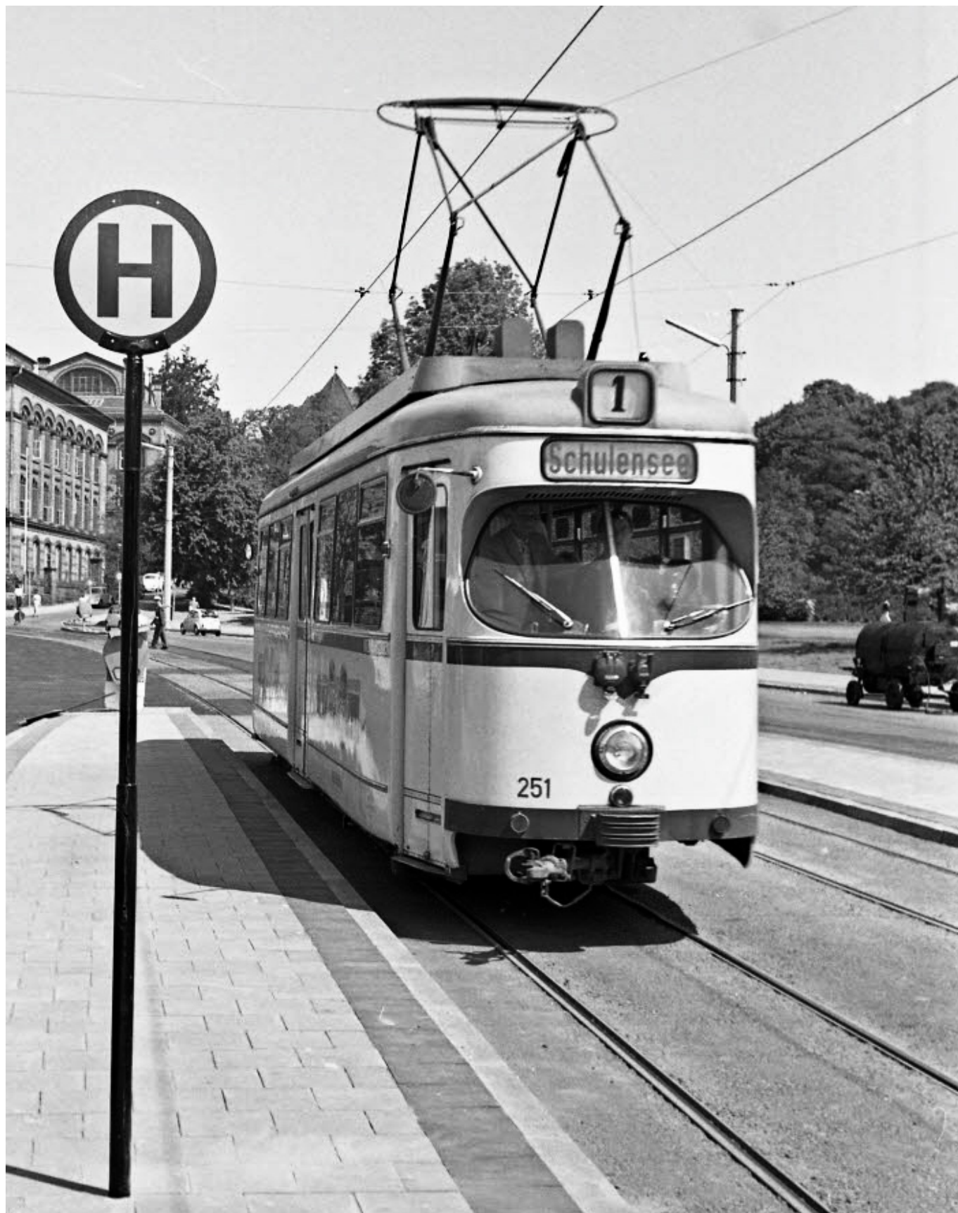
Tramvaj Düwag (T4) ev. č. 251 z roku 1958 patřila mezi jedny z posledních nově dodaných tramvajů do Kielu. Po ní následoval ještě vůz ev. č. 252 a v roce 1960 posledních 15 článkových vozů GT6. V provozu se udržela až do roku 1985.

Na počátku 90. let se řada měst nechala strhnout úspěchem vlakotramvajů v Karlsruhe, kde v roce