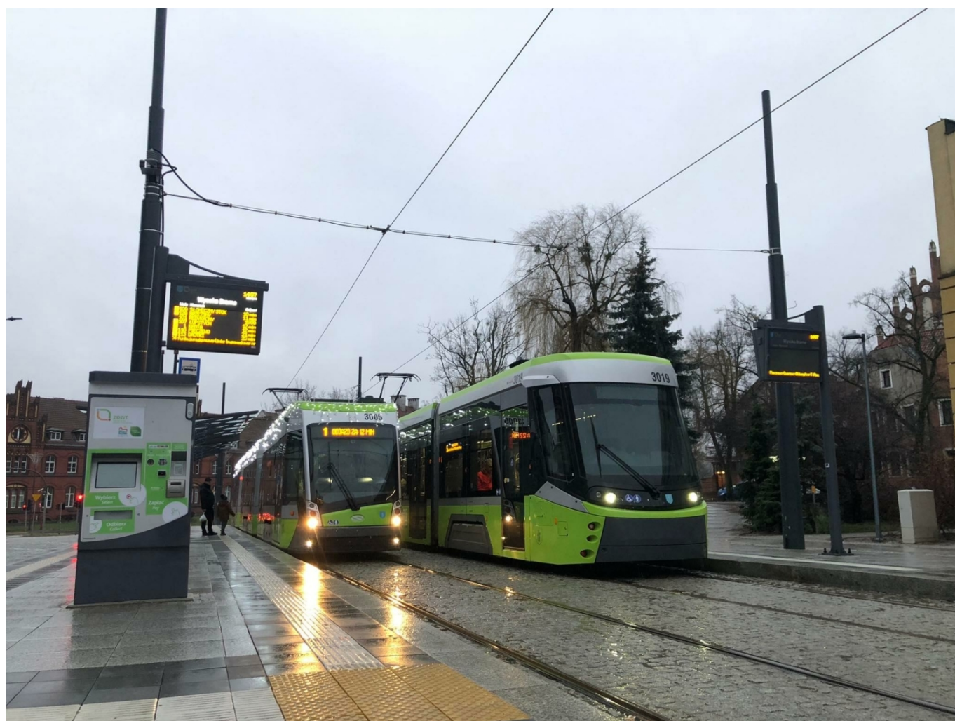
Tramvaje Solaris Tramino a Durmazlar Panorama na nové konečné Wysoka Brama v centru města,

Samotné stavební práce se rozeběhly v srpnu 2021, byť již v únoru město na vlastní náklady přistoupilo k vykácení zeleně, která stála budoucí tramvajové trati v cestě. Pokud by město s kácením otálelo a čekalo až na rozhodnutí soudu, hrozilo by, že by se výstavba tramvajové trati už nestihla v programovém období, na něž byly přiklepnuty z EU finanční prostředky, tj. do konce roku 2023. Kácení tak bylo nutno provést v předstihu kvůli období vegetačního klidu a nehnězení ptactva. Celkem padlo za obětí tramvajové trati okolo 1 300 stromů, což se potýkalo s nelibostí některých občanů. Projekt přitom původně počítal jen se skromnou náhradou v podobě 205 nových stromů, nakonec se však město rozhodlo, že pověření v rámci víceprací vítězné konsorcium výsadbou dalších 800 stromů, navíc vypsalo samostatnou soutěž na zasazení dalších 1 835 stromů a 1 470 keřů, čímž mělo být zajištěno, že pokácené dřeviny budou novými nahrazeny v poměru 2:1.