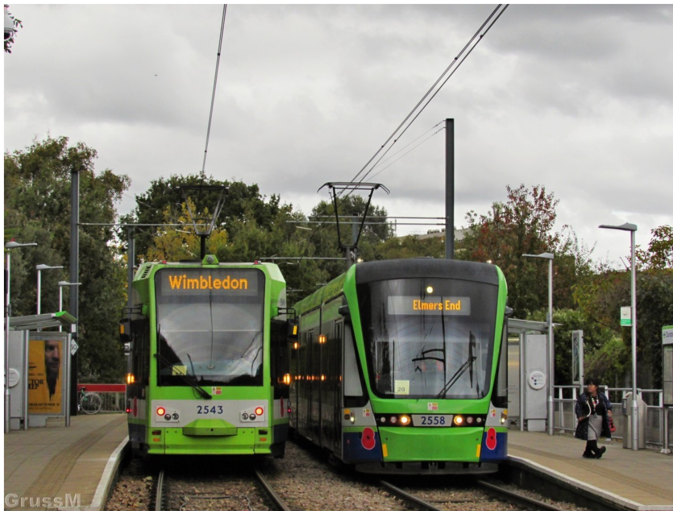
Setkání vozů Bombardier a Stadler na tramvajové trati v Londýně.

V roce 2013 bylo u Stadleru objednáno dalších 6 vozů Variobahn, které byly dodány v letech 2014 až 2016, čímž počet tramvají stoupl na 36 vozů. Tento početní stav ale trval pouze 5 dnů. Po vážné nehodě dne 9. 11. 2016, při níž došlo k převrácení jednoho z vozů CR4000 (ev. č. 2551) poblíž zastávky Sandilands a úmrtí sedmi lidí, klesl počet vozů na 35, což je stav, který platí doposud. Ve špičce je vypravováno 31 vozidel, takže provozní záloha není nijak velká.