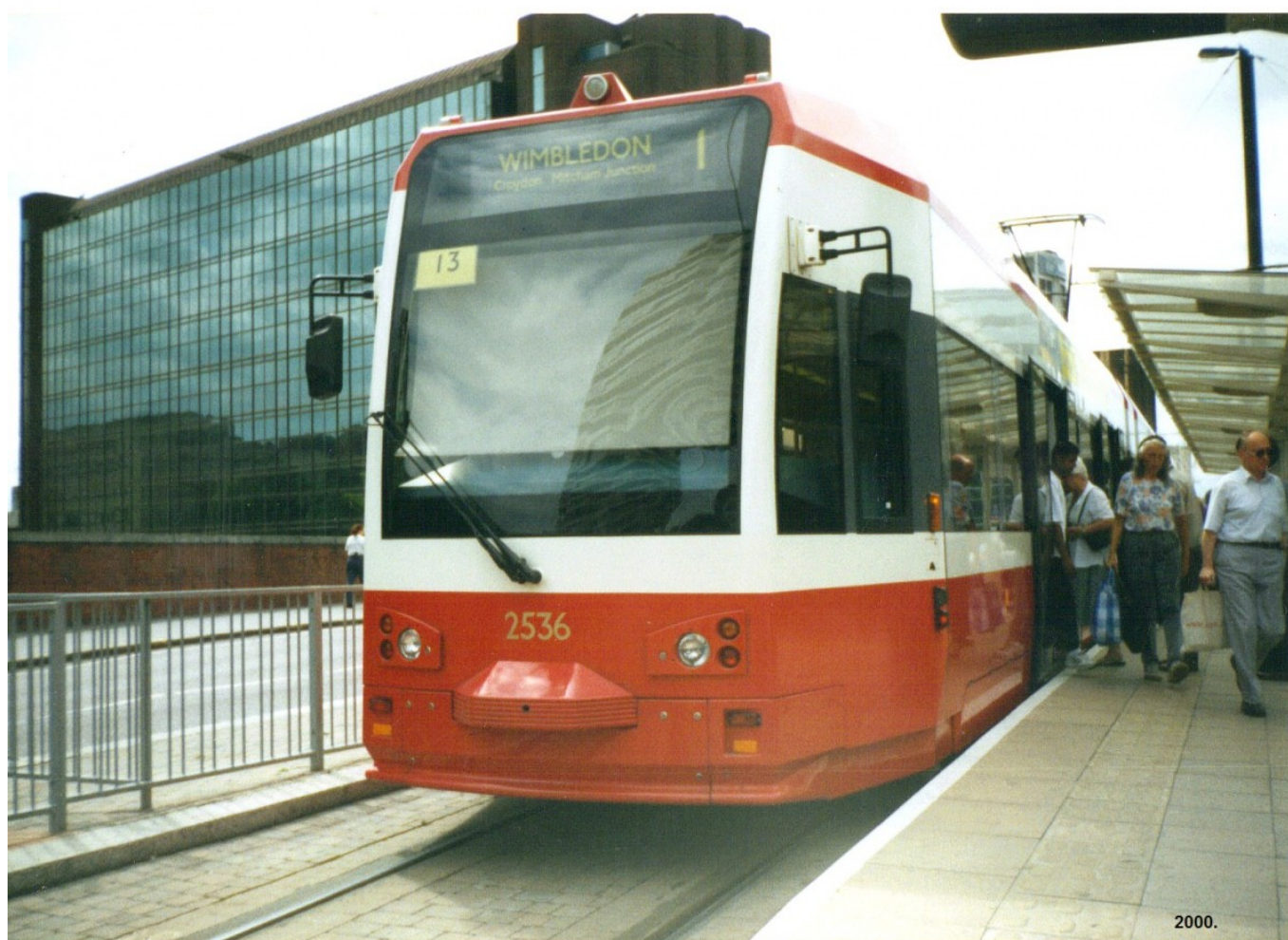
Původní provedení vozu Flexity Swift (CR4000) na lince do Wimbledonu v roce 2000.

Na počátku 90. let se však o tramvajích pro Londýn začalo opět hovořit. Nešlo ale o záměr napojit jimi oblasti v centru, ale o vytvoření spojnic na samotném jižním okraji Londýna. Základem se mělo stát těleso železniční trati West Croydon - Wimbledon, která byla postavena již v roce 1855, a dále část železniční trati Mid-Kent Railway z roku 1862. O jejich možné konverzi na tramvajový provoz se hovořilo prokazatelně již v roce 1962, reálných obrysů začal plán nabývat až v 80. let. První studie byly zpracovány v roce 1986 a v roce 1991 již probíhaly veřejné konzultace projektu, jenž později vstoupil ve známost jako Croydon Tramlink. Bylo rozhodnuto, že tramvajový systém bude postaven na klíč, jak bylo v té době obvyklé také pro jiná města, jež už na návratu tramvajů pracovala. Jelikož však v těchto městech pokaždé stavěl tramvajový systém jiný zhotovitel, byla přenositelnost zkušeností pro londýnský projekt v podstatě minimální.