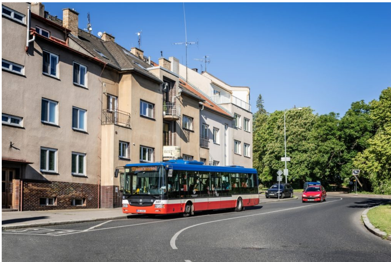
1. června 2020 se SOR NB 12 CITY ev. č. 3687 podíval netradičně na 6. pořadí linky 131. Zvětšněn byl v zastávce Špitálka.

V rámci druhého velkého rámcového tendru byla nejprve uzavřena smlouva na stovku kloubových vozů a teprve v dubnu 2018 na 150 standardních NB CITY. V návaznosti na ně byl nejprve v listopadu 2017 poslán do hostivařských garáží předváděcí SOR NB 18 CITY ev. č. 6950, načež se od prosince stejného roku rozeběhly dodávky nasmlouvaných sériových autobusů ev. č. 6951–6999 a 5001–5050. V červenci byl konečně do hlavního města zapůjčen i „sólo“ předváděcí vůz ev. č. 3801, na nějž navázaly sériové dodávky až do č. 3950. V srpnu 2019 DPP uzavřel dodatky smluv na zbylé autobusy obou délkových kategorií, přičemž jejichž zařazování do provozu se rozeběhlo po krátké pauze od prosince 2019.