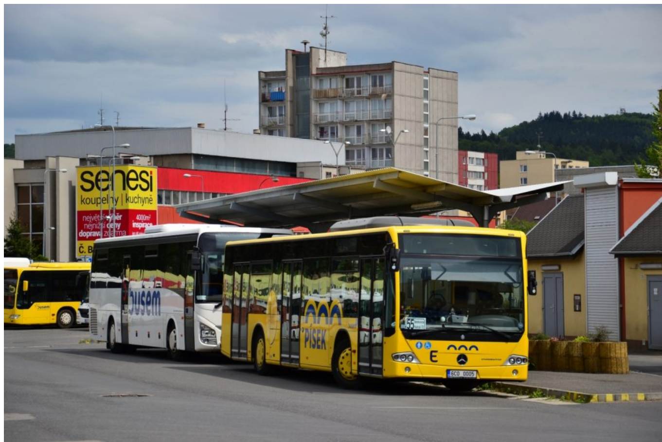
Odcházející tvář MHD Písek. Mercedes-Benz Conecto LF ev. p. E odpočívá na Prvního máje v prostorách autobusového nádraží.

Elektrobus SOR EBN 8 pojme celkem 51 cestujících, z nichž 16 se může za jízdy posadit na skořepinová sedadla STER a další dva na sklopné sedáky. U delších vozů EBN 11,1 se kapacita zastavila na 86 pasažérech, z nichž sedět za jízdy může 31, z toho opět dva na sklopných sedácích v prostoru pro kočárky a invalidní vozíky. Obě délkové modifikace jsou vybaveny asynchronním motorem TAM 1052 6CA od Pragoimexu o výkonu 120 kW. Zadní hnací náprava G 150 pochází od amerického výrobce Dana. Vozy jsou plně klimatizované a nechybí v nich ani nezávislé naftové topení Eberspächer - tradiční součást českých elektrobusů. Vozy Iveco Urbanway 12M CNG očekávané na přelomu října a listopadu budou poháněny motorem Iveco Cursor 8 v kombinaci s automatickou převodovkou Voith D 854.6. Autobusy budou dodány ve standardní třídvéřové variantě s 29 místy k sezení a 56 na stání. I ony nabídnou cestujícím klimatizaci salonu.