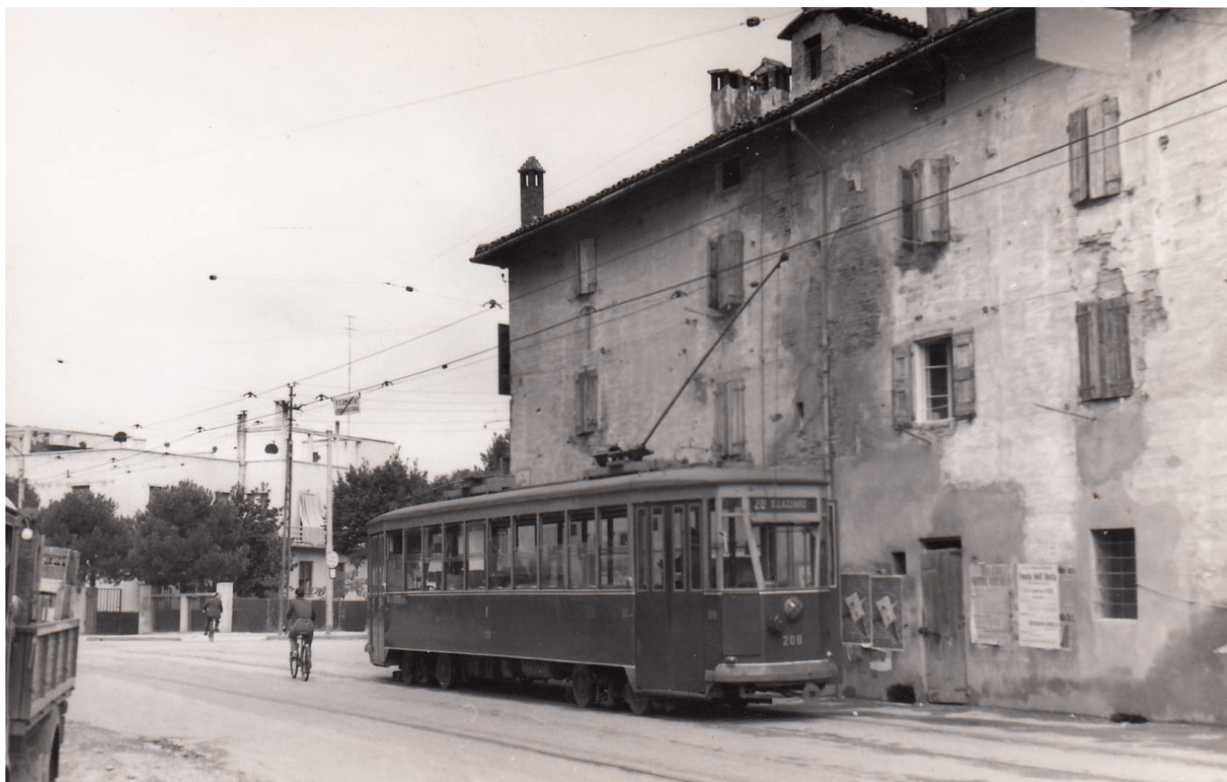
Tramvaje v Boloni jezdily v letech 1880 až 1963. Na snímku z roku 1959 vidíme jeden z čtyřnápravových vozů z druhé poloviny 30. let.

Tento název byl odvozen od trolejbusů Irisbus Civis, které byly v počtu 49 kusů vyrobeny pro plánovaný systém čtyř tras s optickým naváděním, avšak nikdy nesvezly cestující a později byly ostudně zlikvidovány. Další pokus v podobě náhrady Civisů trolejbusy Iveco Crealis sice vedl k jejich uvedení do provozu, avšak projekt jako celek skončil naprostým fiaskem. Politici v Boloni mezitím přicupitali zpět k úvahám o tramvajích, přičemž aktualizovaný Plán městské udržitelné mobility přijatý dne 27. 11. 2018 počítal s vybudováním čtveřice linek (červené, zelené, žluté a modré), které měly nahradit páteřní autobusové a trolejbusové linky ve městě. Stejně jako před dvaceti lety, obrátila se Boloňa i tentokrát na římskou centrální vládu s nataženou dlaní, na níž potřebovala vysázet balíky eurových bankovek, které by pomohly ambiciózní sen přeměnit ve skutečnost. A z města na Tibeře přišla dne 10. 12. 2019 potěšující zpráva – stát poskytl Boloni 509 mil. € (tehdy cca 13,7 mld. Kč), které měly pokrýt takřka všechny náklady na zřízení první (červené) linky o délce 16,5 km, z nichž 2 km měly být bez trolejového vedení.