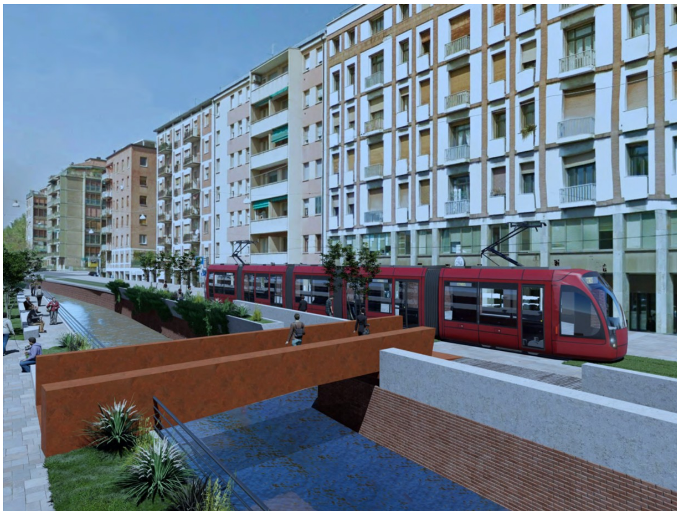
Vizualizace tramvajové tratě v Boloni.

Finance poskytnuté ze státní pokladnice byly určeny nejen na samotnou stavbu tratí, ale i nákup vozidel. Ty se město rozhodlo nakupovat samostatně, přičemž soutěž vypsalo dne 20. 3. 2024. Celkem může město poříditi až 60 tramvají v hodnotě 260 mil. € (6,6 mld. Kč), což by mělo pokrývat potřeby všech čtyř plánovaných tratí. Jde tedy o smlouvu rámcovou, z níž hodlá Boloňa čerpat dle potřeby podle skutečného vývoje výstavby. Pro první etapu (červená + zelená linka) se očekává nákup 33 vozidel. Součástí ceny je i prodloužená záruka na dobu 4 let a údržba po stejně dlouhou dobu.