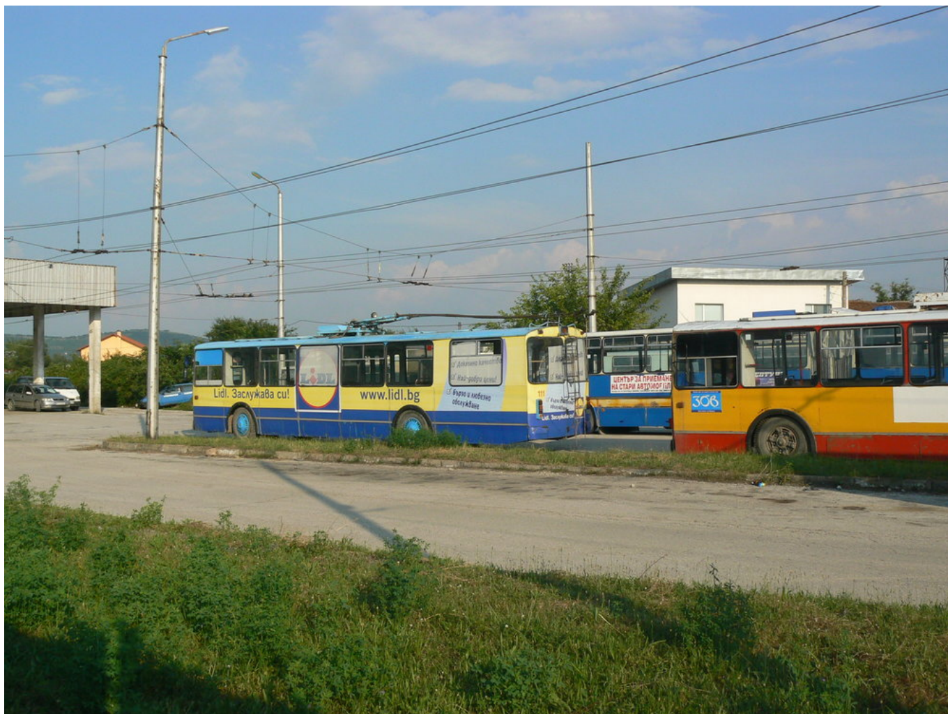
Vozovna, v pozadí Ikarus 280.92.