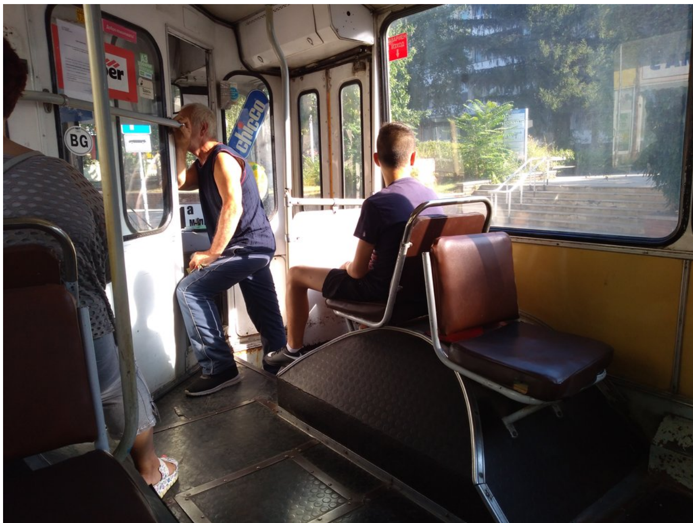
Jízdenky prodává řidič.