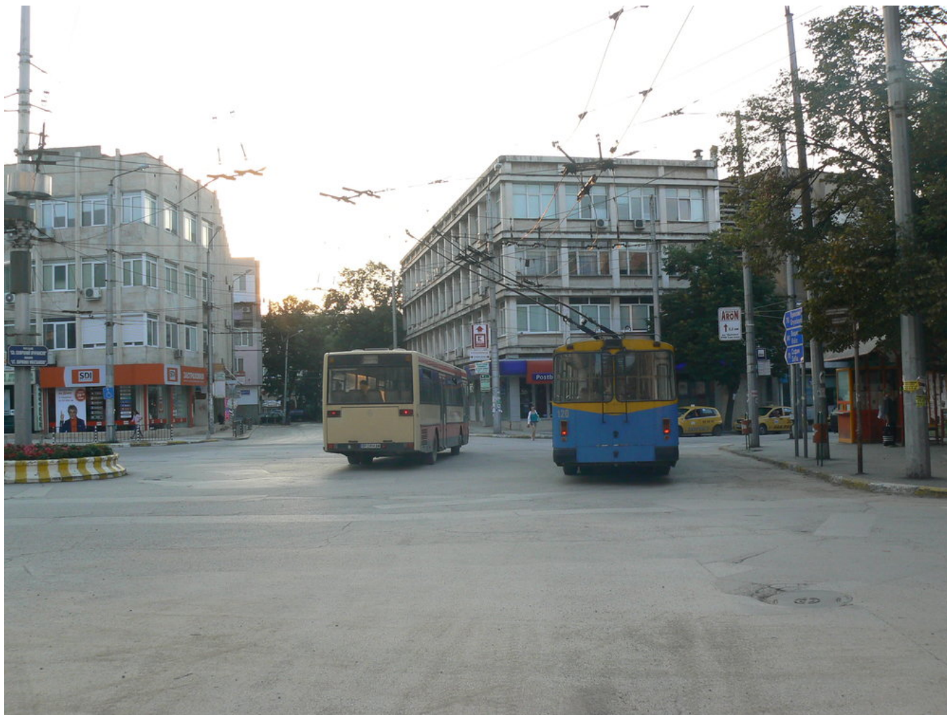
Příjezd autobusu linky „A“ - NAD za trolejbus ve směru Chimki a Medkovec.

Radnice zavelela k obnově vozového parku, který momentálně vykazuje 18 vozů, z toho t. č. 15 funkčních. Loni padl návrh na pořízení šesti ojetých vozů, teď to ovšem vypadá, že se s pomocí unijních fondů podaří nakoupit trolejbusy nové. Jmenovitě by se mělo pořídit 10 nových trolejbusů a k nim by mělo přibýt ještě 15 elektrobuses. Jak je zřejmé, obnova trolejbusového parku nebude úplná, ale sotva dvoutřetinová. Avšak bez navracení provozu na dnes již neobsluhované úseky je počet 10 vozů naprosto dostačující, na druhou stranu ale neumožňuje žádné další rozšíření sítě. Nicméně se vzhledem k nadšení pro elektrobuses nezdá, že by mělo město v úmyslu troleje ještě někde stavět, a ponechá si tedy asi jen ty stávající. Dosud se ve městě na zkoušku objevily tři elektrobuses, všechny od českého výrobce SOR. Dva z nich zamířily i do města Ruse, o kterém jsme publikovali text včera . Třetí, typu SOR EBN 11.1, se ve Vracc objevil roku 2017.