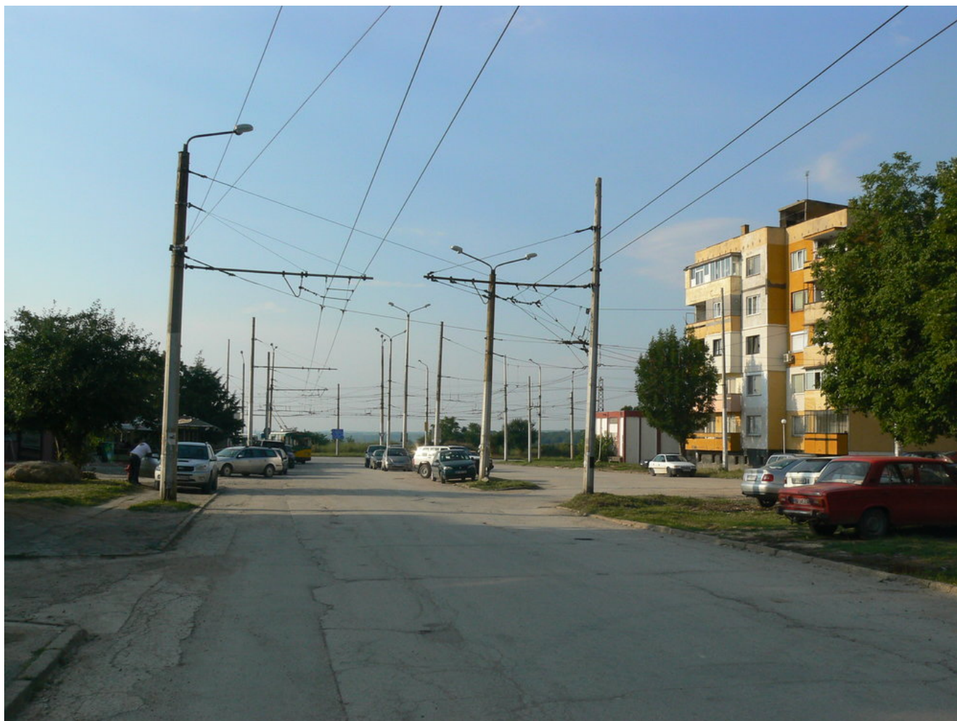
Pohled od trati k vozovně na konečnou Blok 26.