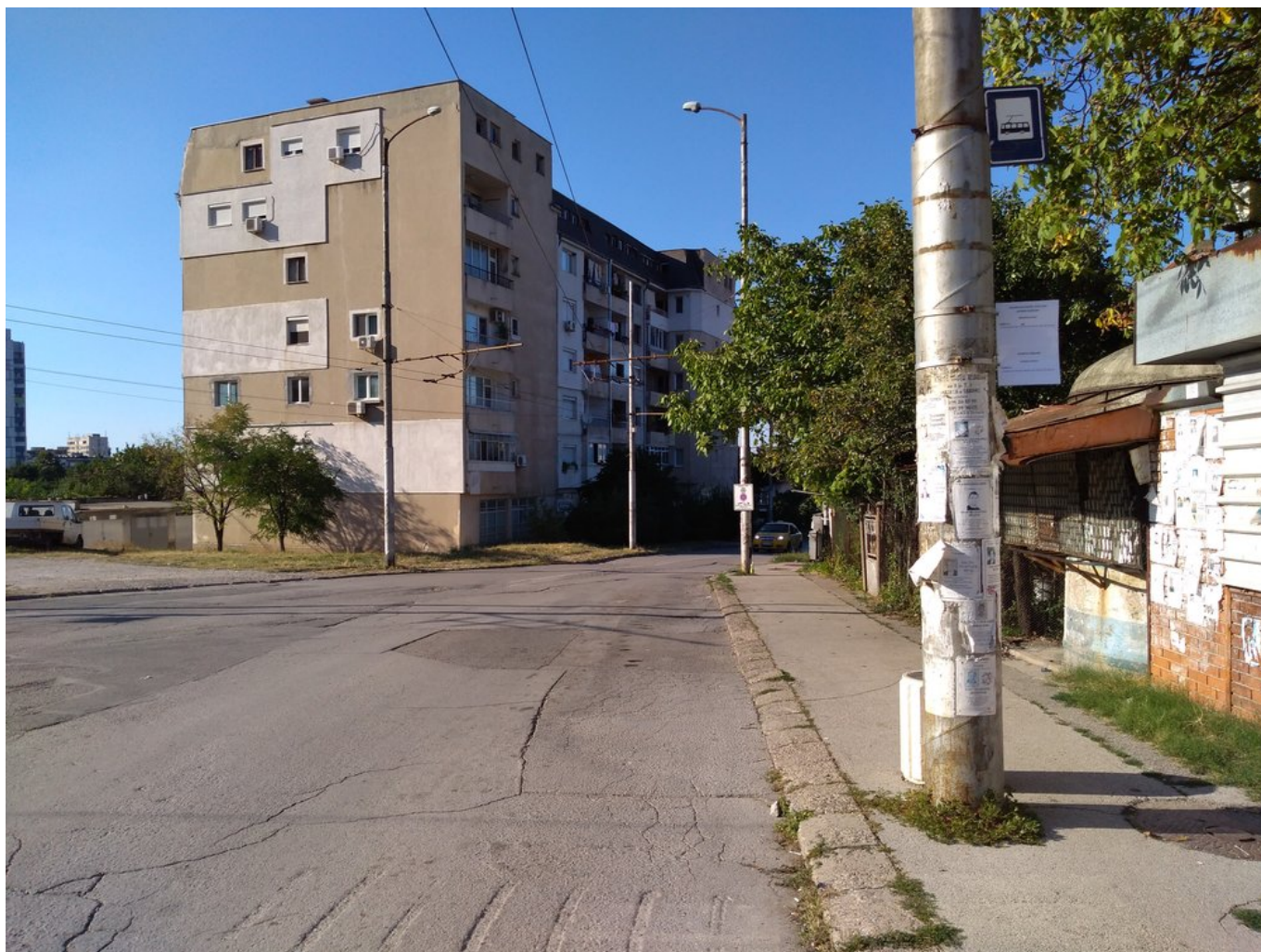
Poslední snímky zachycují romantickou konečnou Medkovec.