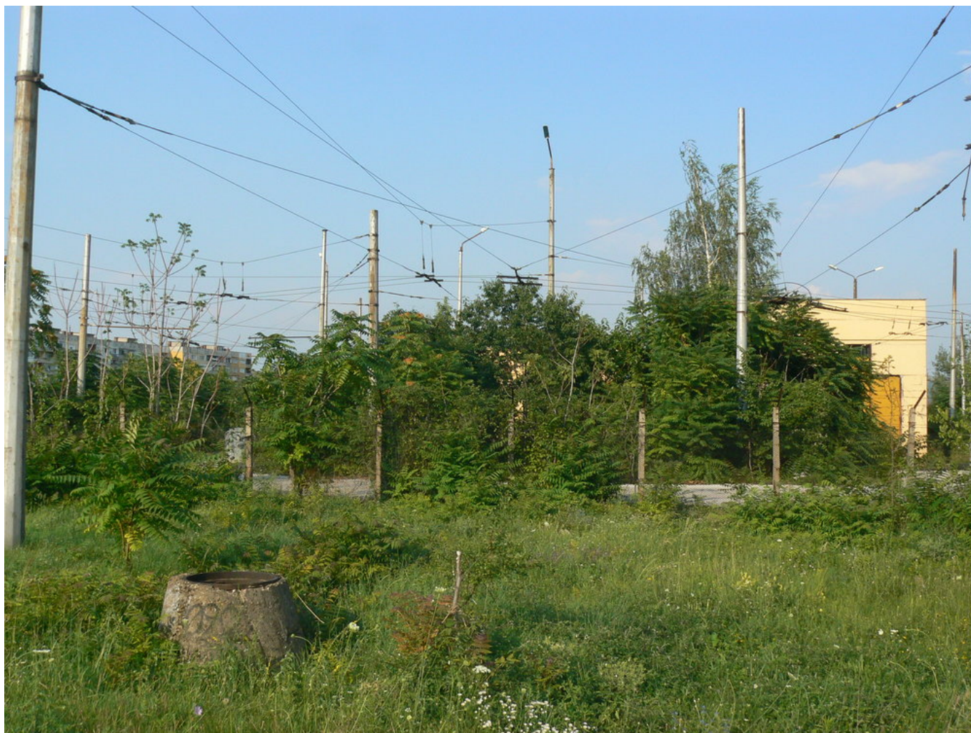
Zadní část vozovny.