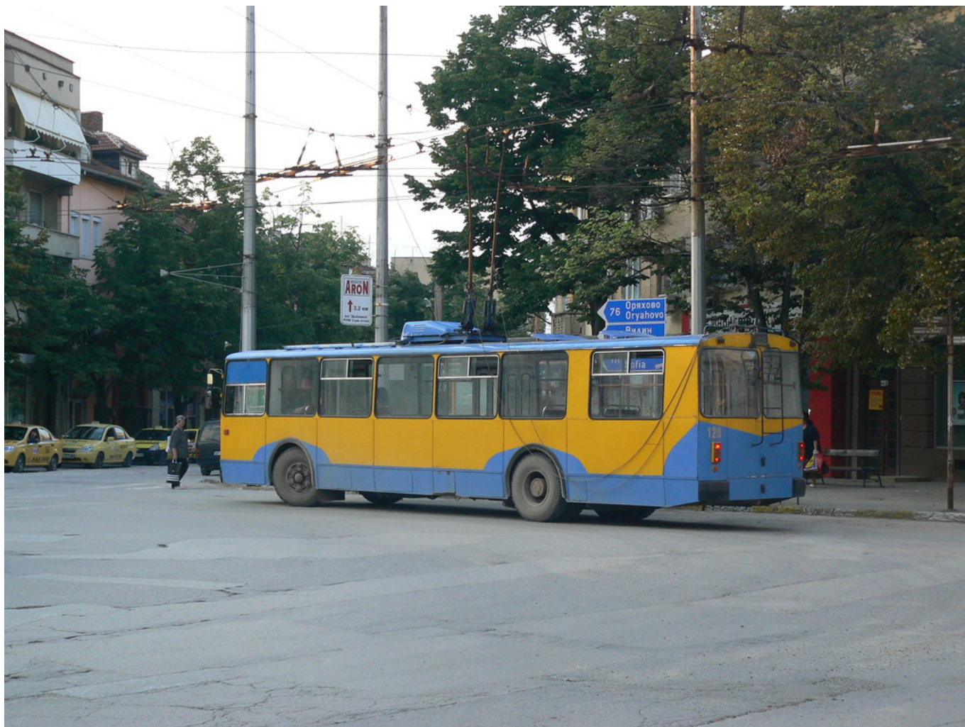
Náměstí Sv. Sofr. Vračanski má kruhový objezd