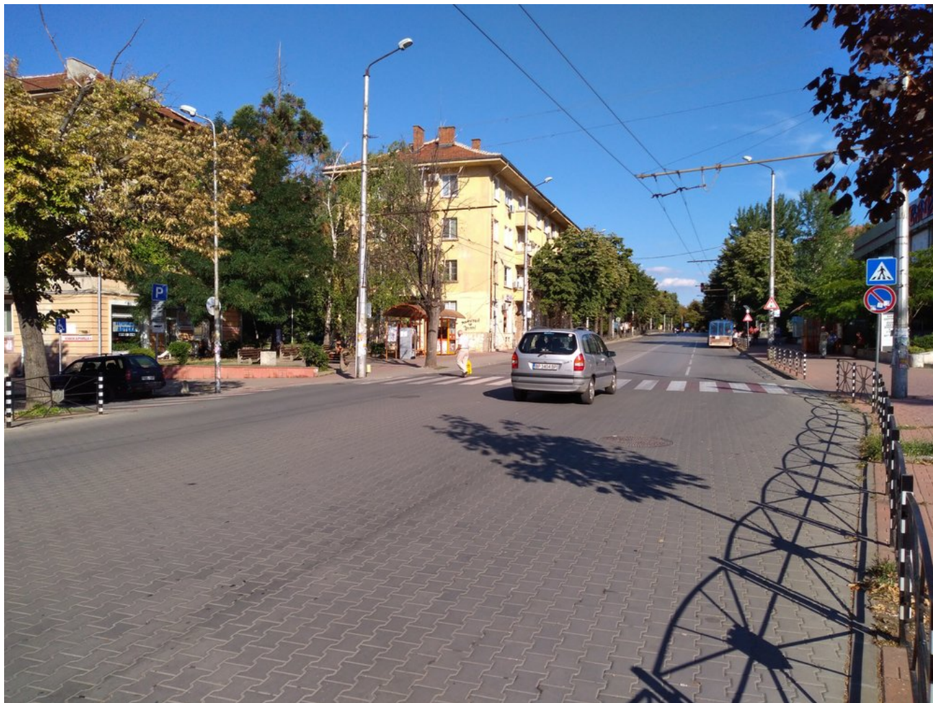
Pohled z náměstí Makedonia na obě strany.