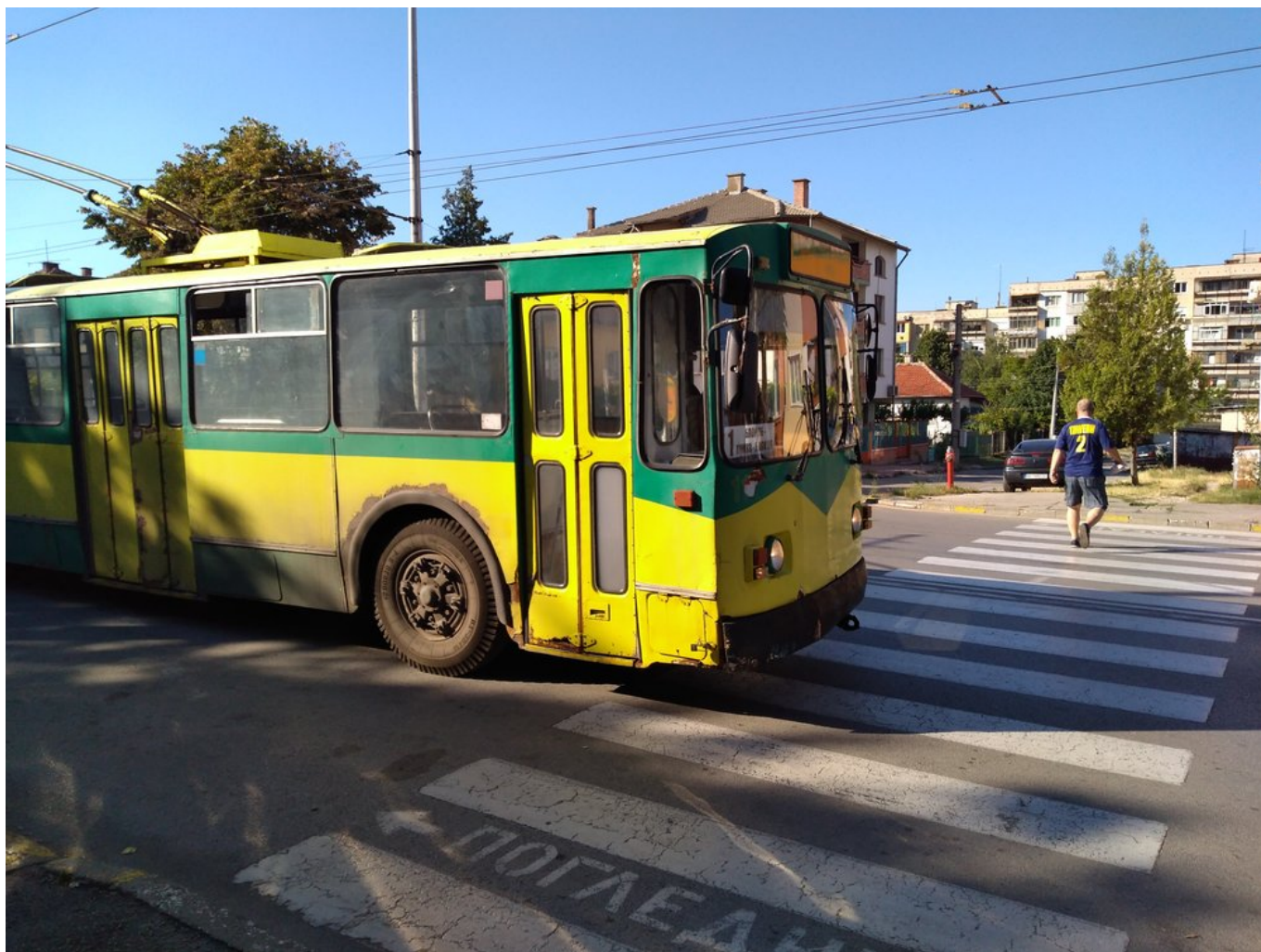
Zastávka Ž. K. Mladost' ve východní části města.