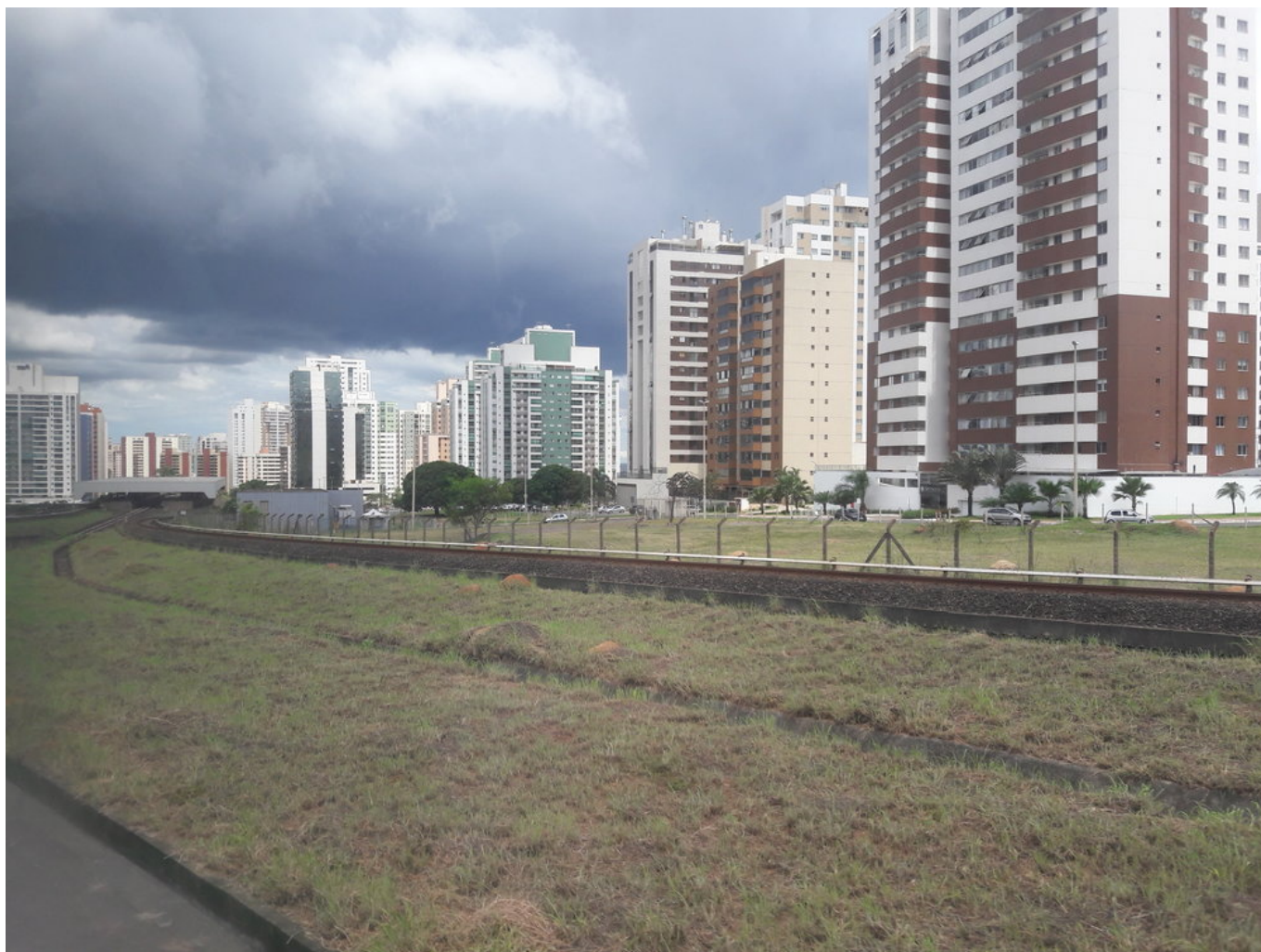
Pohled na stanici Águas Claras při výjezdu směrem do Samambaie.