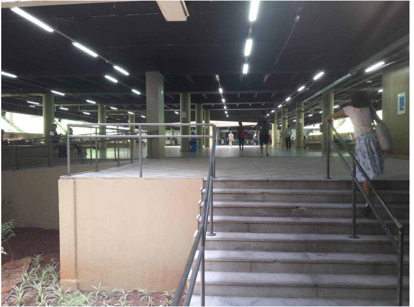
Stanice Central (6x).