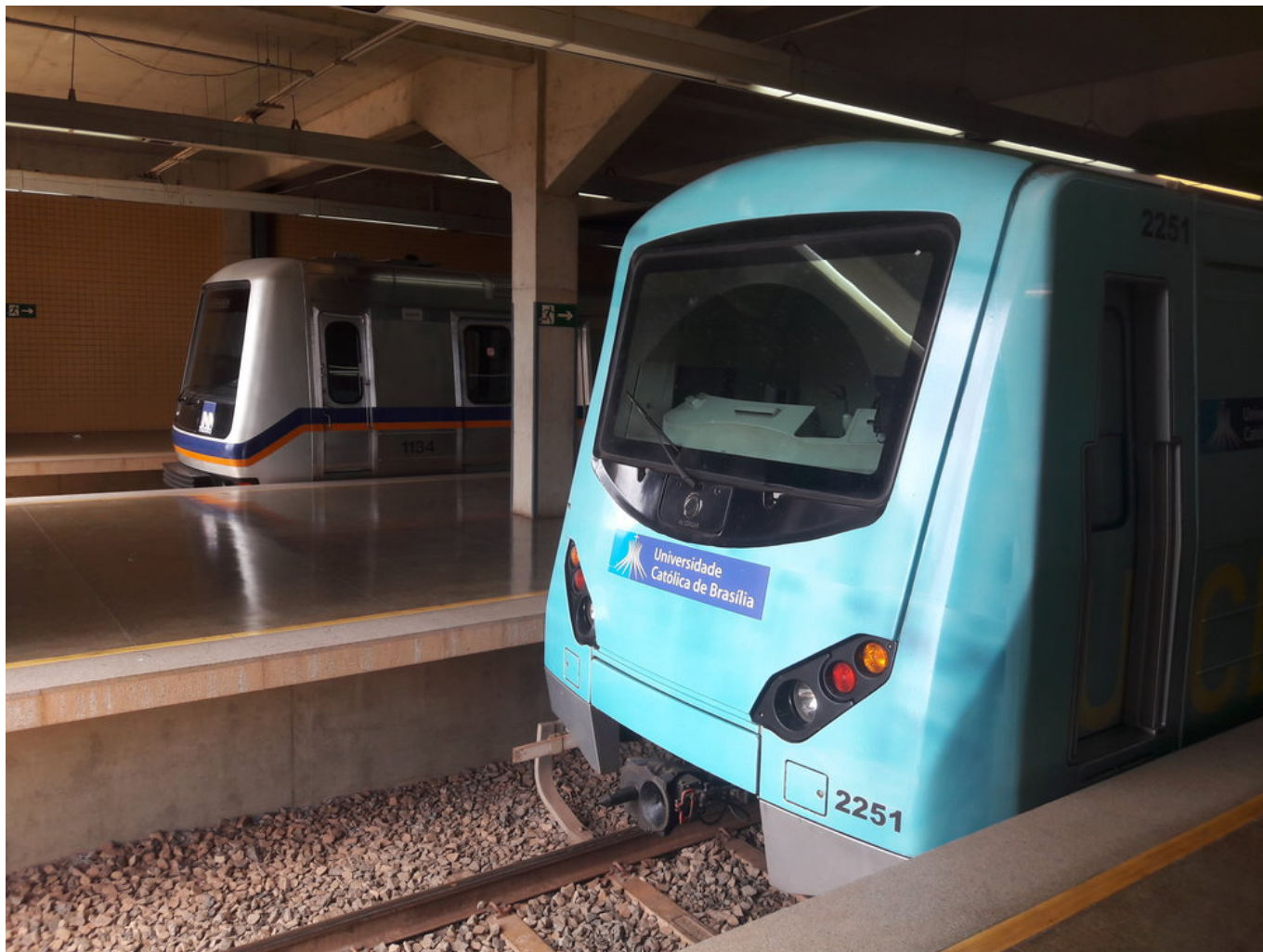
Terminal Samambaia. Konečná stanice.