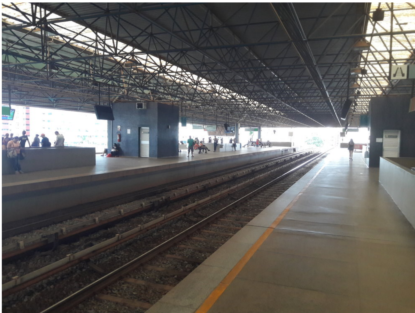
Stanice Águas Claras, poslední sdílená stanice obou linek.