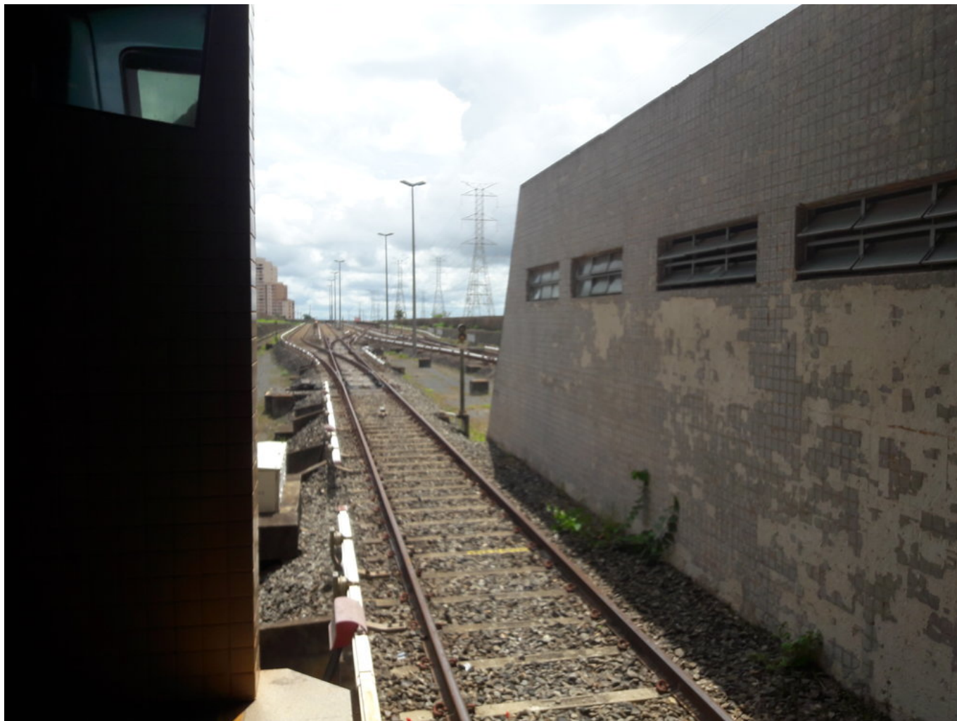
Pohled na koncové (západní) zhlaví oranžové linky (2x.)