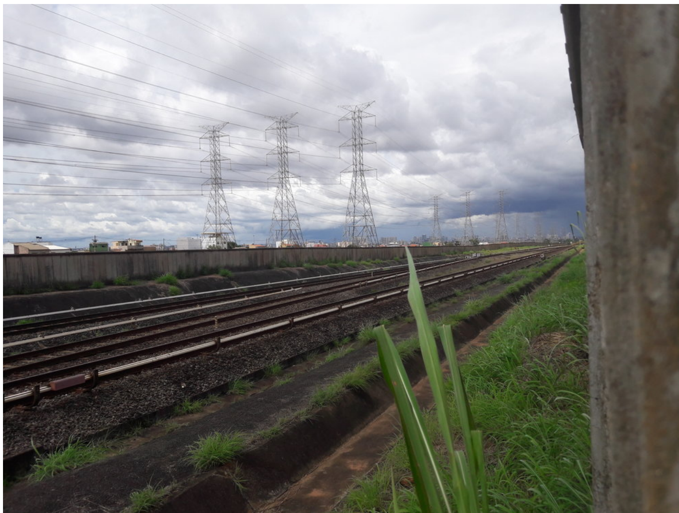
Úsek Terminal Samambaia - Samambaia Sul.