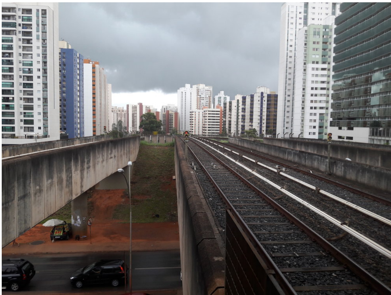
Pohledy směrem k Brasílii.