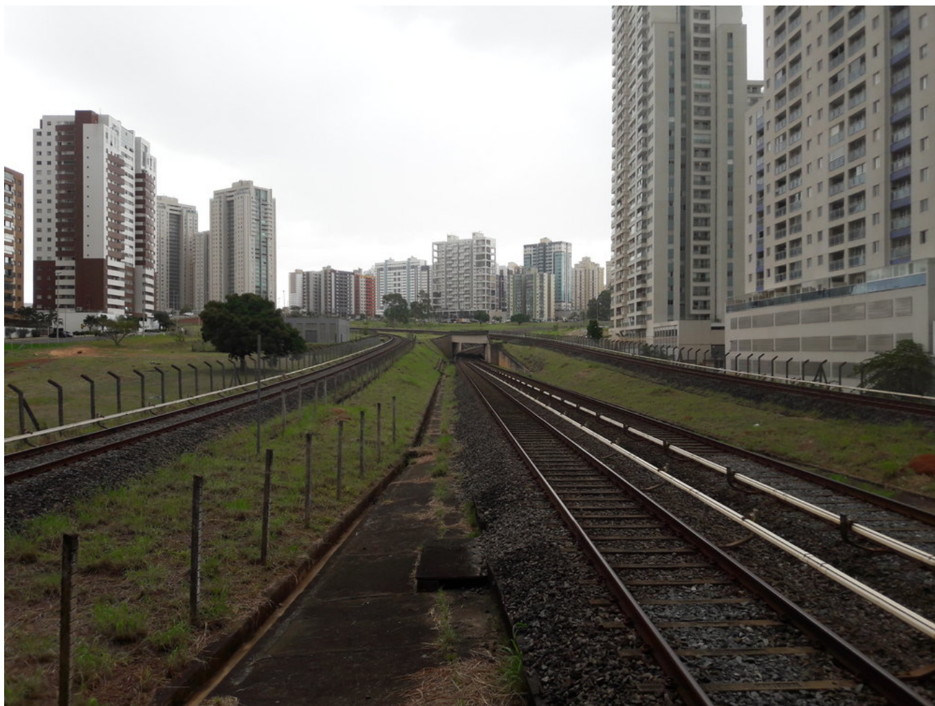
Stanice Águas Claras. Před třiceti lety nebyly výškové domy v dané lokalitě přítomny.