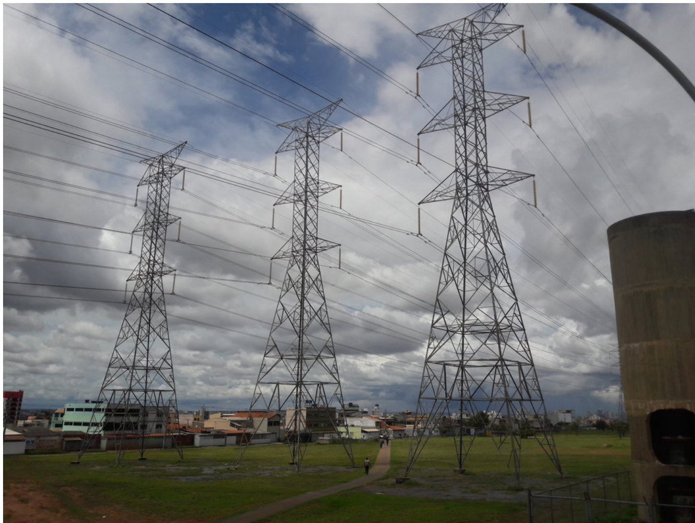
Dráty vysokého napětí z rozvodny Furnas.