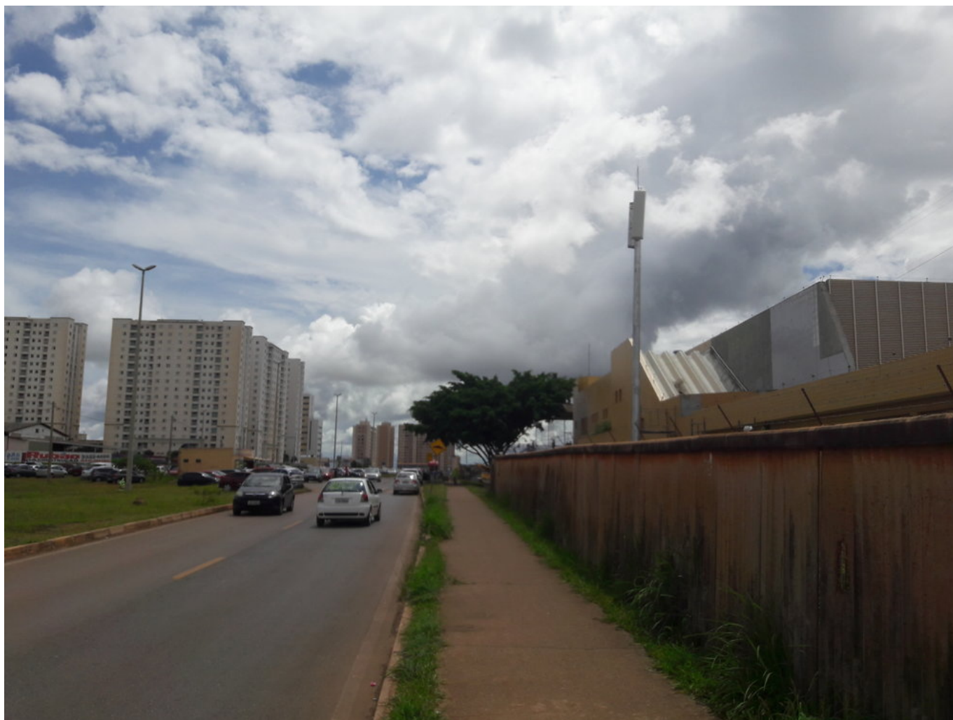
Terminal Samambaia, jižní strana.