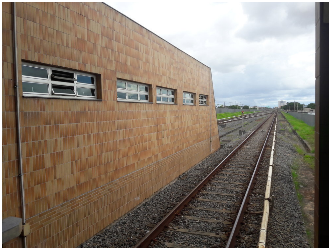
Konečná zelené linky Terminal Ceilândia. Pohled na trať směrem do Brasília.

Toho dne také začaly simulační jízdy s cestujícími na síti Samambaia/Praça do Relógio - Águas Claras - Central. Tato síť měla délku 30,4 km. Dne 24. září 2001 byl konečně spuštěn komerční provoz, který se týkal právě uvedené sítě. V prvních měsících provozu se jezdilo jen od 10 do 16 hodin (dle dostupných informací jen v pracovních dnech, což pak přetrvalo do dalších let). Dle některých zdrojů mělo být roku 2001 v provozu 11 stanic, což zřejmě odpovídá realitě. Evidováno totiž bylo v prvním pololetí roku 1994 šest stanic, v druhém pololetí téhož roku 8 stanic, 17. srpna 1998 se měla otevřít stanice Asa Sul. Dne 31. března 2001 se otevřely stanice Galeria a Central.