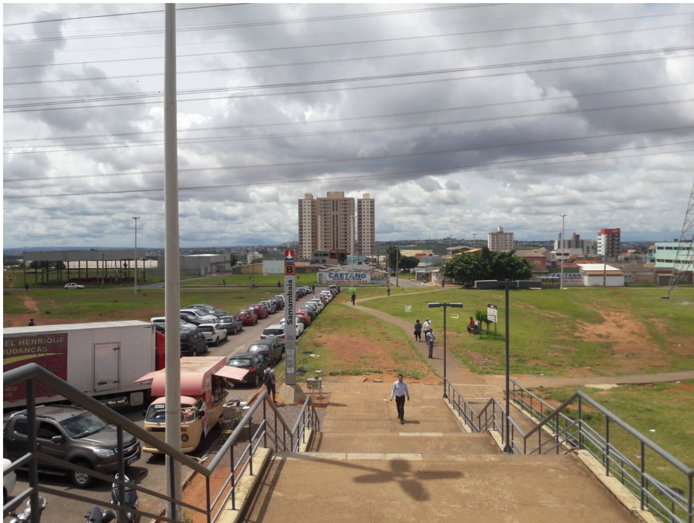
Pohled na sever ze stanice Terminal Samambaia.